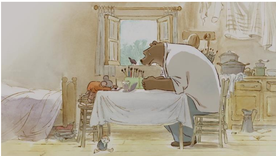
Image 1 : le tabouret, le verre, les pincesaux, dessiner, un oiseau, la poupée, le rideau, la casserole, la cruche, le buffet de cuisine).

Un étudiant regarde l'image et la décrit à l'autre étudiant (qui ne la voit pas). Le deuxième étudiant dessine les objets sur sa feuille à l'endroit indiqué par le premier étudiant. Vocabulaire utile à donner aux étudiants: au premier plan, en arrière-plan, à gauche (de), à droite (de), de l'autre côté (de), au milieu (de), prépositions diverses, noms des objets principaux :